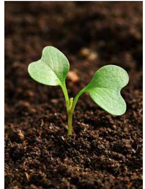
Abfall - Wertstoff - Wachstum

Ziel des Projektes ist es, den rechtlichen und damit einhergehenden administrativen Ablauf zu optimieren, um dadurch die Asche als möglicher Dünger für die Landwirtschaft auf geeigneten Böden interessant zu machen. Weiters auch die Technik für den überbetrieblichen Einsatz zur Verfügung zu stellen und auch eventuell notwendige Untersuchungen des Bodens zu organisieren.