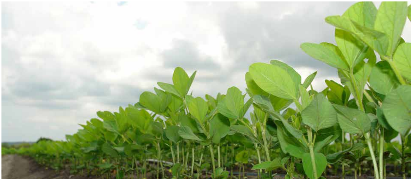
Soja - eine interessante Alternative zu den bestehenden Kulturarten