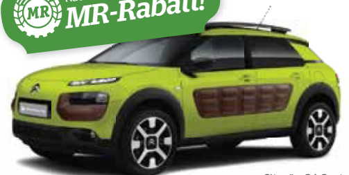
Citroën C4 Cactus

Weitere Informationen bezüglich Autotypen und Rabatte bekommst du bei deinem örtlichen Maschinenring.