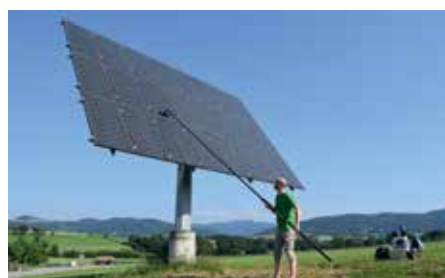
Reinigung mit Umkehrosmose: Für Photovoltaikanlagen, Fassaden und Glasfronten