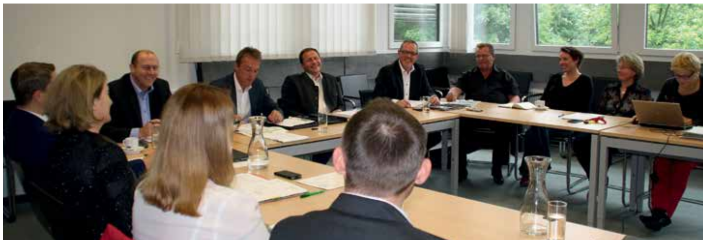
Positive Stimmung bei der ersten gemeinsamen Sitzung mit den Abteilungsleiterinnen und -leitern des MRÖ sowie der MRPS am Standort in Linz.