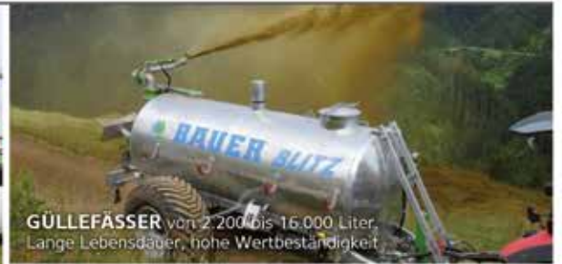
GÜLLEFÄSSER von 2.200 bis 16.000 Liter Lange Lebensdauer, hohe Wertbeständigkeit