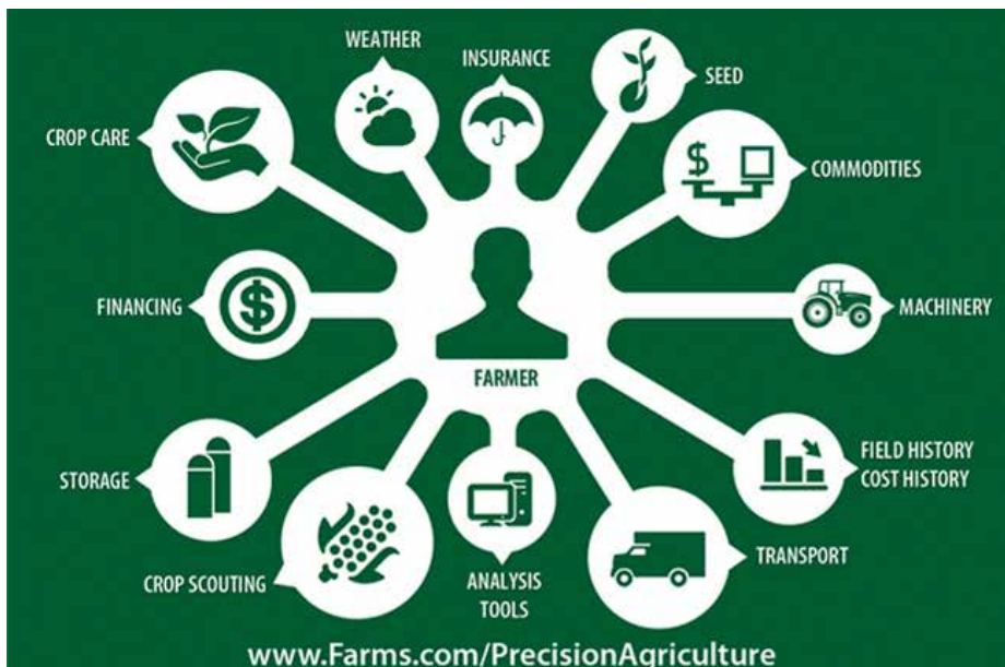
Der Landwirt als zentrale Drehscheibe beim Precision Farming

Inwieweit weitere Projektpartner wie z.B. Landtechnikfirmen, Softwarefirmen etc. ins Projekt integriert werden sollen, gilt es durch das Projektteam zu evaluieren.