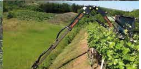
Enorme Reichweite in Weingärten

Interesse an unseren Dienstleistungen oder am Vertrieb der Energreen-Maschinen ? Kontaktieren Sie uns, gerne stehen wir für eine Vorführung zur Verfügung !