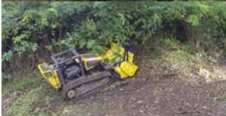
Forstmulchen bis 55° Neigung