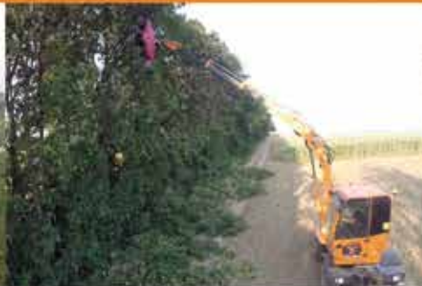
Freischneiden bis 13m Höhe