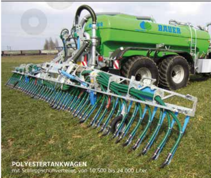
POLYESTERTANKWAGEN mit Schleppschuhverteiler, von 10.500 bis 24.000 Liter