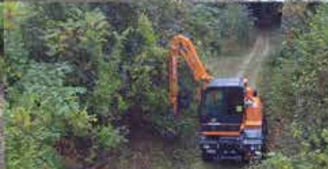
Pflege von Forststraßen