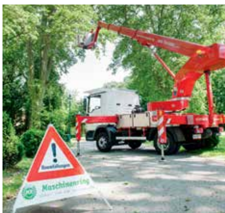
Baumpflege durch den Maschinenring

Diese sorgen mit ihrem Baumbestand für ein angenehmes Wohnambiente, und das will gepflegt werden! Ob Niederösterreichische Wohnbaugruppe, SGN oder Gedesag: ein professionell geführter Baumkataster erleichtert das Management mehrerer Hundert Wohnhaus-Bäume auf zahlreichen Objekte im Weinviertel