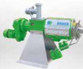
SEPARATOREN zur Separierung von festen und flüssigen Nährstoffen, hoher Durchsatz