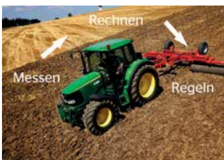
Mit Sensoren wird der Bestand erfasst

Somit baut dieser Begriff auf Precision Farming auf, das heißt: