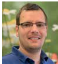
Roman Nigischer Kundenbetreuung Personalleasing