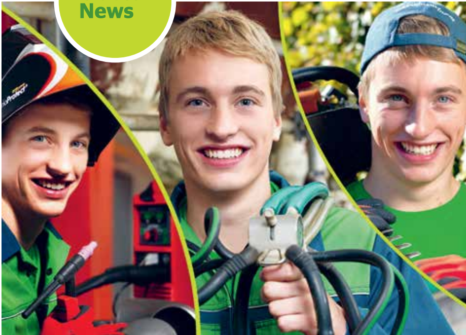
Beste Zukunftsperspektiven mit dem vielseitigen Ausbildungsprogramm zur Wirtschafts- und Agrar-Fachkraft