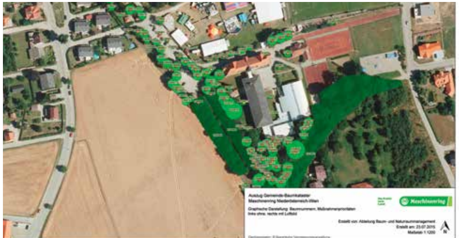
Auszug aus einem Baumkataster

enorm. Die Pflege des wertvollen, Schatten spendenden Grüns kann nämlich erst dann koordiniert ablaufen, wenn jeder Baum verzeichnet und bewertet ist. Bereits mehr als 90 Gemeinden haben ihren Baumbestand bereits dem Maschinenring anvertraut.