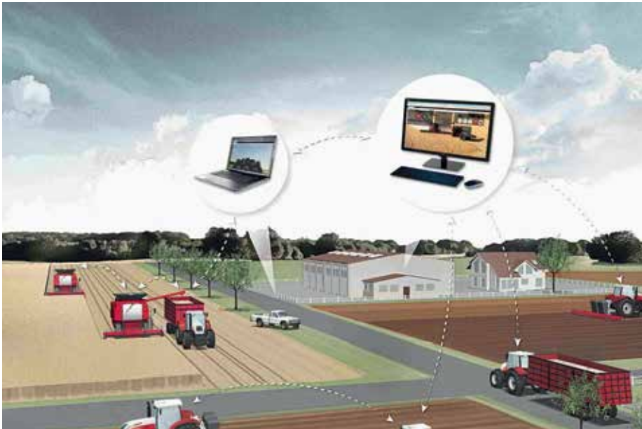
Landwirtschaft 4.0 - Der Traktor in der Cloud?

Um all diese Anforderungen unter einem Begriff zu subsumieren, wurde in Anlehnung an den Begriff „Industrie 4.0“ speziell für den Agrarbereich der Begriff „Landwirtschaft 4.0“ generiert.