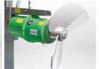
TAUCHMOTOR-RÜHRWERKE mit enormer Rührkraft und hohem Wirkungsgrad