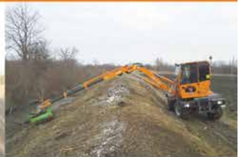
Forstmulchen bis 12m Reichweite

Böschungsmähen · Freischneiden · Forstmulchen · Schilfschneiden