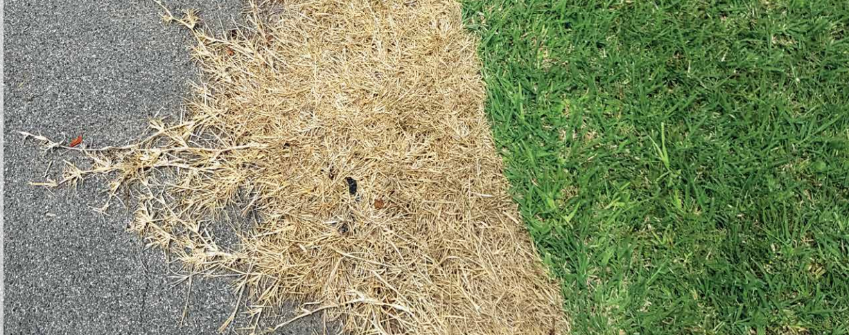
Eine mit Heißschaum und Heißwasser behandelte Fläche wenige Tage nach der Anwendung

Die Hitze zerstört das Eiweiß der Pflanze sowie deren Keimlinge und Samen in kürzester Zeit. Heißschaum ist vollständig biologisch abbaubar, wird ohne Druck flächig aufgetragen und fällt nach etwa 15-30 Minuten rückstandslos in sich zusammen.