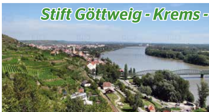
Stift Göttweig - Krems -