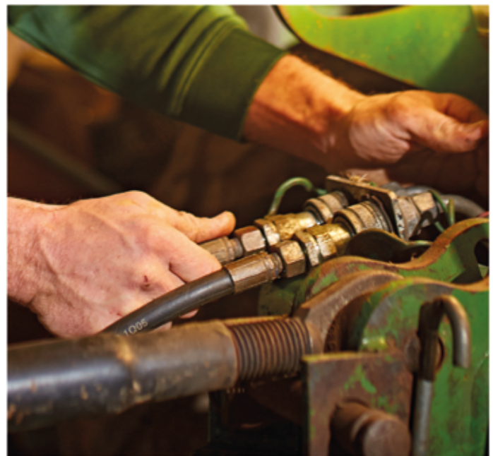
Jobs mit Handschlagqualität. Egal in welcher Branche - Maschinenring Personalleasing bietet echte Arbeit in deiner Region.

nen ein: eine Generation, die vom Arbeitgeber mehr verlangt als gute Bezahlung, Flexibilität und Weiterbildungsmöglichkeiten. Wenn die Work-Life-Balance zählt, ein Sabbatical geplant ist oder neben dem eigenen Start-up-Unternehmen Einkommensquellen gesucht werden, bieten wir individuelle Arbeitszeitmodelle an. Personalleasing bietet hier alle Möglichkeiten“, so die selbst aus einer Bauernfamilie stammende Oberösterreicherin.