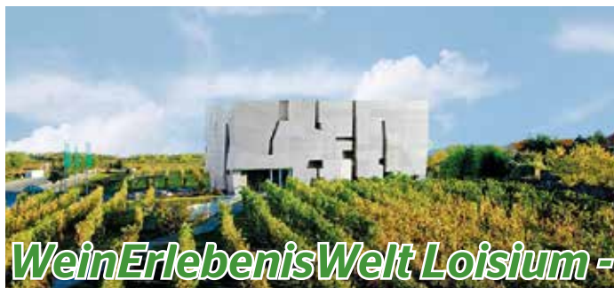
WeinErlebnisWelt Loisium -