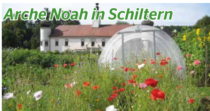
Arche Noah in Schiltern