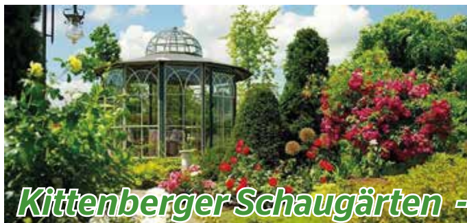
Kittenberger Schaugärten -