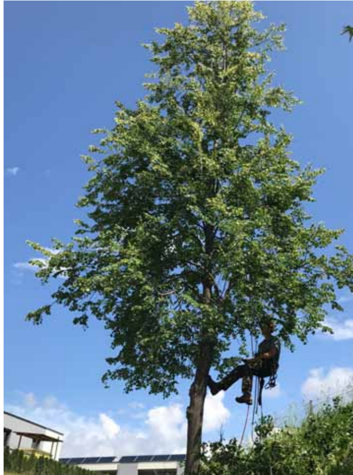
Wenn es um spezielle Baumpflegearbeiten geht, sind die Spezialisten des Maschinenring Villach - Hermagor im Einsatz.

Erstmals durften wir heuer für den Magistrat Villach Sommerdienst-Arbeiten durchführen. Wir wurden beauftragt, an mehreren Bäumen einen fachgerechten Schnitt durchzuführen. Des Weiteren wurden in verschiedenen Stadtteilen Mäharbeiten durchgeführt. Auch für die ÖBB in Villach konnten wir im Sommer unsere qualifizierten Dienstleister für Baumpflegearbeiten einsetzen.