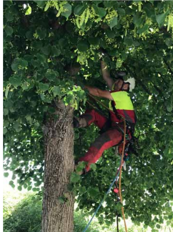
Mit viel Geschick und Know how werden die Bäume oft in luftiger Höhe bearbeitet.