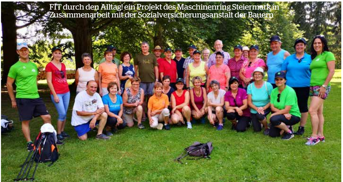
FIT durch den Alltag! ein Projekt des Maschinenring Steiermark in Zusammenarbeit mit der Sozialversicherungsanstalt der Bauern

Im Zuge unseres Gesundheitskompetenzring-Projektes luden wir zu einer Wanderung ein.