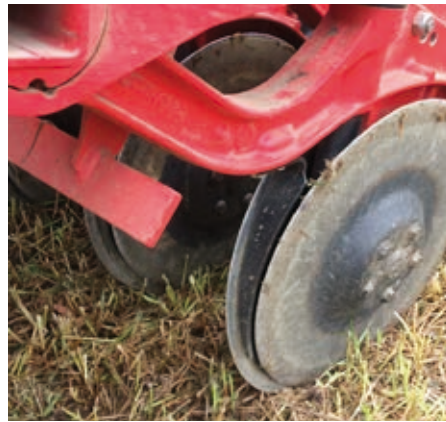
Scheibenschar bei der Arbeit