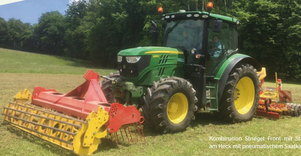
Kombination Striegel Front mit Striegel am Heck mit pneumatischem Saatkasten