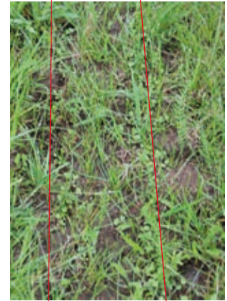
Sichtbare Erfolge in der Reihe

Generell kann aber gesagt werden, dass alle Möglichkeiten tauglich sind um die Grünlandbestände in Top Form zu bringen um hochwertiges Grundfutter am eigenen Betrieb erzeugen zu können!