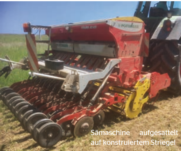
Sämaschine aufgesetzt auf konstruiertem Striegel