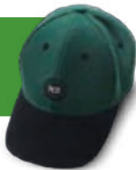
Baseball-Kappe MR grün Artikelnummer: 10999-08

Das gesamte Sortiment findest du unter shop.maschinenring.at