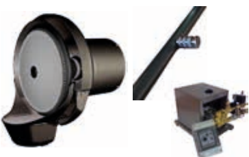
Moderne Düsenlose System sowie Hochdruck Komponenten zum Selbstbau direkt vom Entwickler

Stallkühlung Luftbefeuchtung Staubreduktion A-Z Eignet sich für Reiferäume, Kühlager, Hozfasskeller uvm.