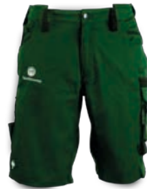
Engelbert Strauss Short e.s.motion Herren Artikelnummer: 110003