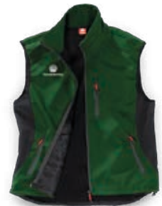
Engelbert Strauss Softshellweste dryplex e.s. Herren Artikelnummer: 110006