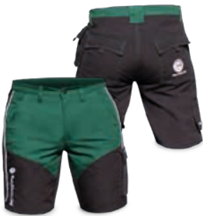
Bundhose kurz Artefix MR Grün-Schwarz Artikelnummer: 11143

Mit den leichten Shorts aus starkem Canvas Gewebe (65% Polyester, 35% Baumwolle) und den T-Shirts aus 100% Baumwolle bist du für Arbeiten bei hohen Temperaturen optimal ausgestattet.