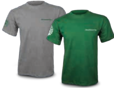
T-Shirt grau MR Artikelnummer: 11180