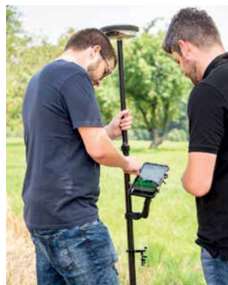
Abb. 2: Exakte Aufnahme mit der MR Smartantenne

Hier kommt unsere Maschinenring Smartantenne (Leihgerät) zum Einsatz.