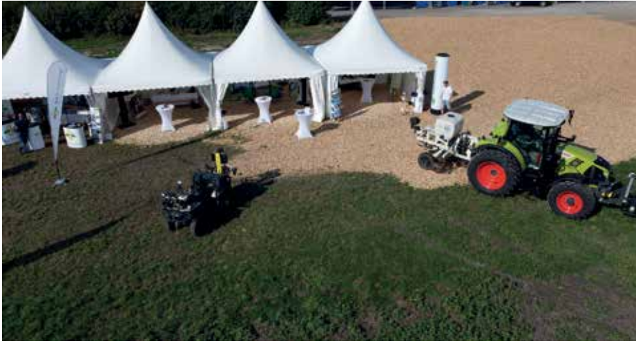
Anziehungspunkte am Maschinenring-Stand: Bodenproben-Quad und Bodensensor

Am 6. und 7. August konnten bei den Biofeldtagen 2021 am Seehof in Donnerskirchen insgesamt mehr als 11.000 Personen begrüßt werden. Produzenten wie Konsumenten trafen sich zum Dialog über biologische Landwirtschaft am Bio-Landgut Esterhazy in Donnerskirchen.