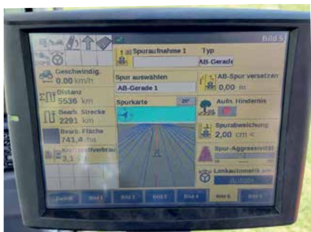
Abb. 1: AFS 700 Terminal - AB Spurplanung

Mit diesem Gerät nimmt man den tatsächlichen, der Natur entsprechenden Verlauf der Feldaußengrenzen mit zwei Zentimeter Genauigkeit auf. Hierbei ist darauf Rücksicht zu nehmen, dass die Aufnahme entsprechend dem automatisiertem Fahrverhalten erfolgen muss.