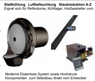
Stallkühlung Luftbefeuchtung Staubreduktion A-Z Eignet sich für Reiferäume, Kühlager, Hozfasskeller uvm.