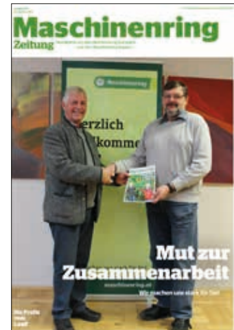
1. gemeinsame Mitgliederzeitung

In Form von aktuellen Newslettern wollen wir unsere Mitglieder in Zukunft in Abständen von 2 - 3 Monaten informieren. Von vielen von euch haben wir schon E-Mail-Adressen. Alle anderen bitten wir um Bekanntgabe einer aktuellen E-Mail Adresse direkt per Mail an