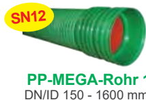
PP-MEGA-Rohr 12 DN/ID 150 - 1600 mm