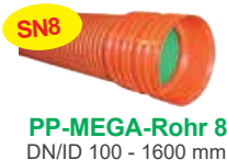
PP-MEGA-Rohr 8 DN/ID 100 - 1600 mm