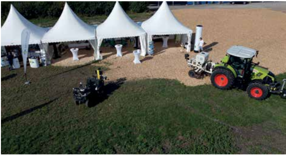
Anziehungspunkte am Maschinenring-Stand: Bodenproben-Quad und Bodensensor

Am 6. und 7. August konnten bei den Biofeldtagen 2021 am Seehof in Donnerskirchen insgesamt mehr als 11.000 Personen begrüßt werden. Produzenten wie Konsumenten trafen sich zum Dialog über biologische Landwirtschaft am Bio-Landgut Esterhazy in Donnerskirchen.