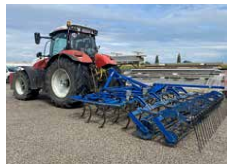
Gemeinschaftstraktor mit Allrounder

Mittlerweile sind die meisten Hersteller so kooperativ, dass eine Möglichkeit zum Import bzw. zum Übertragen von Felddaten und Spuren von einem Lenksystem