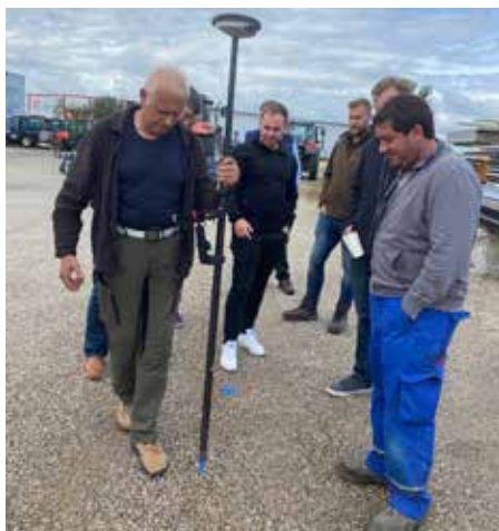
Teilnehmer testen die Smartantenne

Die Veranstaltungsteilnehmer wurden anschließend auch über weitere Anwendungsbereiche der Maschinenring Smartantenne informiert, wie z.B. die Grenzpunktsuche auf Basis von Koordinaten (entweder mittels manueller Eingabe oder digitalem Import) sowie die Aufnahme von Drainagen (inkl. Höhenkoordinaten/Verlegetiefe).