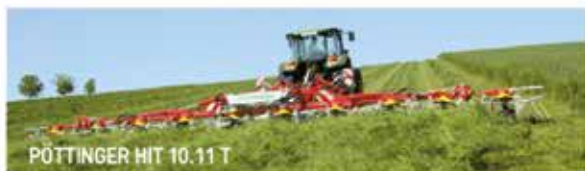
PÖTTINGER HIT 10.11 T