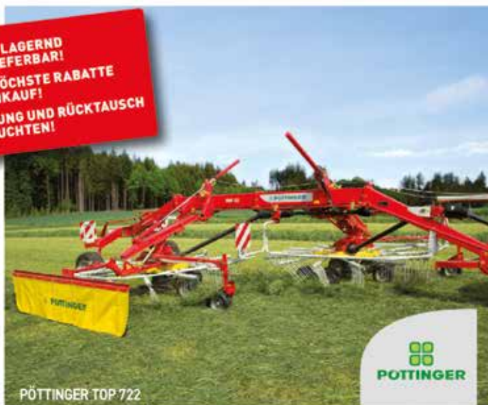
PÖTTINGER TOP 722