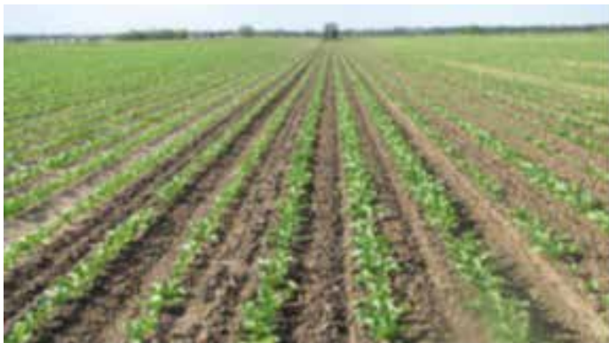
Selbstständiges Hacken auf höchster Geschwindigkeit

Das Einsatzspektrum reicht von einfachen Parallelfahrhilfen (Anzeige über Lichtbalken) über Teilbreitenschaltungen für Feldspritzen mit elektrisch schaltbaren Teilbreiten bis hin zu Aufgabemengensteuerungen für Düngerstreuer. Für besondere Anforderungen können auch noch zusätzliche Anbaugeräteleitungen wie Verschieberahmen für Pflanzmaschinen oder Hackgeräte, Deichsellenkungen und Scheibensech-Lenkungen eingesetzt werden.