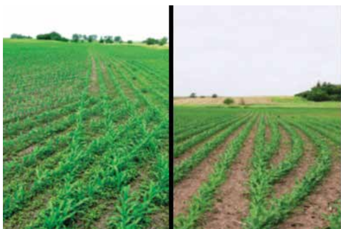
Überlappung vermeiden durch automatische Reihenabschaltungen im Pflanzenbau