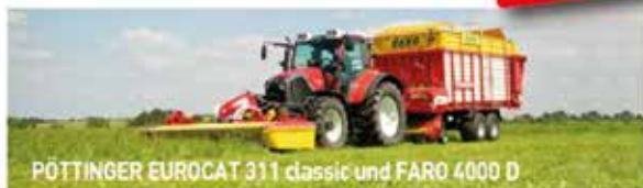
PÖTTINGER EUROCAT 311 classic und FARO 4000 D

ALLE MODELLE LAGERND UND SOFORT LIEFERBAR! JETZT NOCH: HÖCHSTE RABATTE DURCH VOREINKAUF! BESTE BERATUNG UND RÜCKTAUSCH IHRER GEBRAUCHTEN!