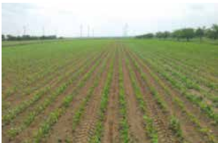
Zwiebelbeete perfekt angelegt, so sieht Präzision im Gemüsebau aus

RTK-VRS gesteuerte Aussaat und anschließendes Hacken von Reihenkulturen wie Mais bringt große Erleichterung für z.B. Biogetreideproduktion