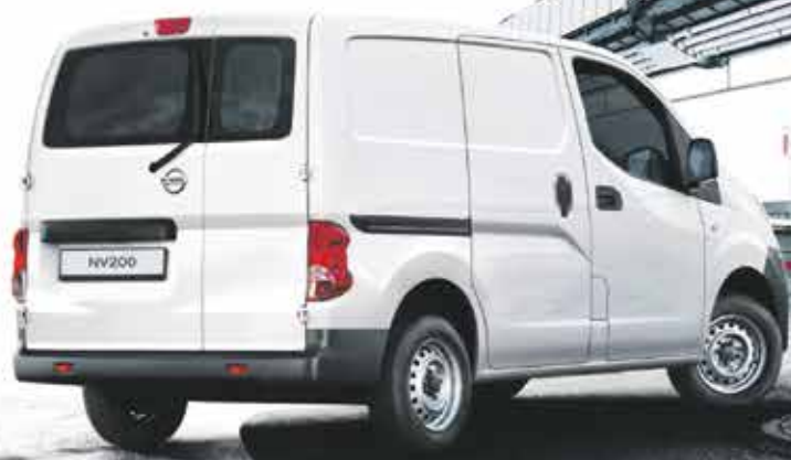
Abb. zeigt Symbolfoto. *NISSAN NV200 Kastenwagen COMFORT Cool & Sound inkl. manueller Klimaanlage und Radio/CD-Kombination mit Bluetooth*-Freisprechanlage. Gültig bis 30.06.2014. Nur für Firmenkunden.

TOP SONDERAKTIONEN für Mitglieder des Maschinenringes und für Jäger