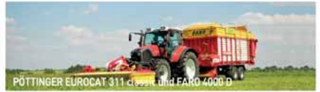
PÖTTINGER EUROCAT 311 classic und FARGO 4000 D