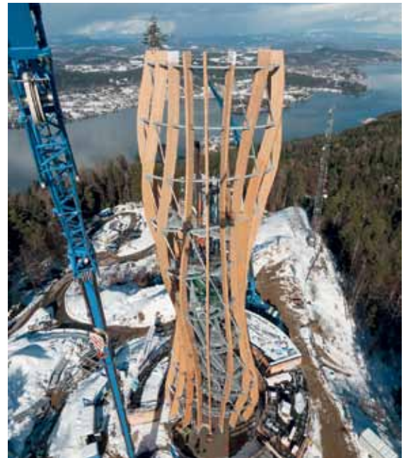
Baubeginn bei Schnee und Kälte im Februar 2013

Mitarbeiter der Maschinenring Personal eGen waren bei der Montage des neuen Kärntner Wahrzeichens dabei.