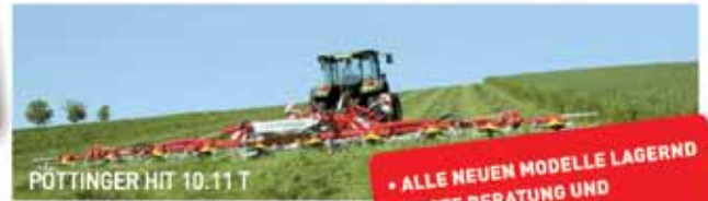
PÖTTINGER HIT 10.11 T