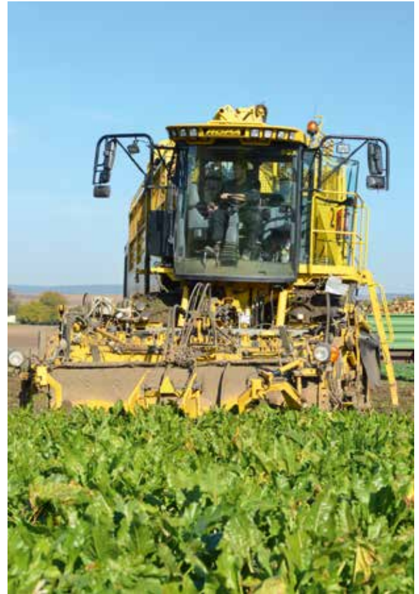
Zuckerrübenernte durch die Rübenrodegemeinschaft Laa/Thaya

Somit stehen der Landwirtschaft nun schlagkräftige Gemeinschaften zur Verfügung, die mit moderner Technik professionelle Dienstleistungen im Zuckerrübenbau anbieten können.