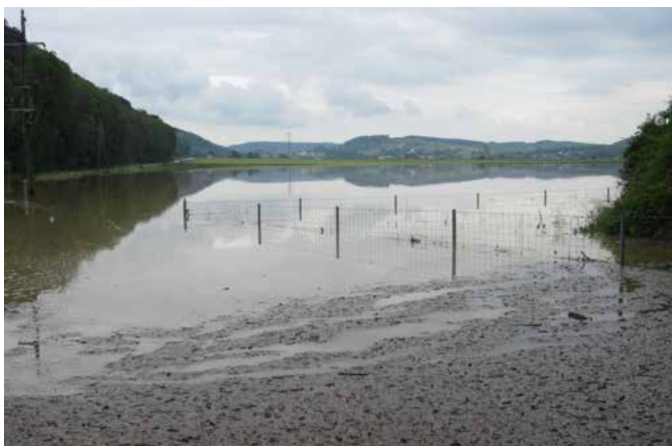
Überschwemmte Agrarflächen in Melk, Katastralgemeinde Winden.

Sollten Sie einen entsprechenden Schaden durch das Hochwasser noch nicht bekannt gegeben haben, so ist jetzt noch eine Meldung an die Gemeinde möglich.