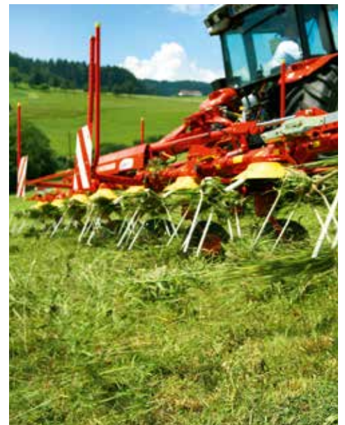
Verbessertes Grünfutter für mehr Milchleistung