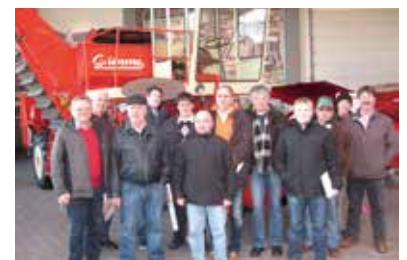
Der erste selbstfahrende zweireihige Kartoffelroder, BJ. 1974