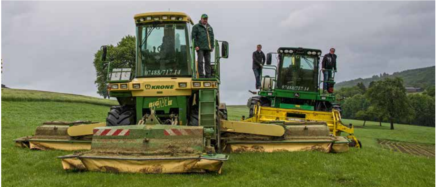
Big M II und Feldhäcksler der Firma Luger aus Pyhrfeld

Der Maschinenring arbeitet mit Lohnunternehmern zusammen. Das hat Vorteile für das Unternehmen selbst, für den Maschinenring und natürlich auch für den Auftraggeber.