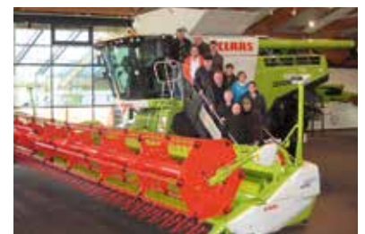
Claas Lexion 780 mit Raupenfahrwerk und 12 m Schneidwerksbreite

Bei voller Produktion verlassen alle 15 Minuten ein Mähdrescher und alle 50 Minuten ein Feldhäcksler das Werk. Nach einem Abstecher zu einem Kartoffelbaubetrieb mit eigener Einlagerung und Vermarktung folgte ein Besuch bei der Firma Grimme in Damme. Im neu gebauten Werk werden Selbstfahrer für die Kartoffel- und Rübenernte gebaut, im Stammwerk sämtliche Geräte für die Kartoffelproduktion hergestellt.