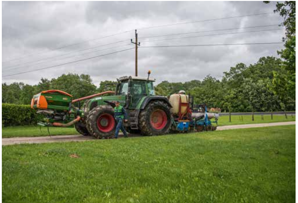
Erstmals seit 2012 in Österreich im Einsatz: Oeko Streifenfräse

Auf Feldern mit kräftigen, abgefrosten oder mit immergrünen Zwischenfrüchten wie Grünroggen oder winterharten Kleearten trocknete der Boden am besten ab.