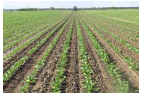
Selbstständiges Hacken mit höchster Genauigkeit

Unerlässlich für unsere Produktion sind nicht nur die exakte Geschwindigkeitsanzeige und der exakte Flächenzähler, sondern auch die Dokumentation der bearbeiteten Flächen und Ausbringungsmengen sowie die Festlegung genauer Feldstückgrenzen. Schließlich