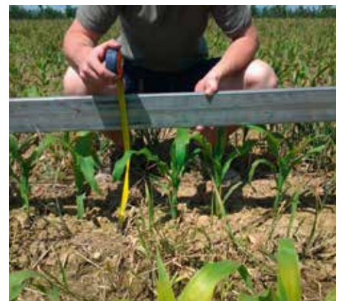
Der Mais in diesen Flächen ist ca. 8 cm höher als auf den Bereichen, wo mit der Kreiselegge vorgearbeitet wurde

Durch die Saat mit OekoSem wird weniger Fläche bearbeitet, dadurch erhöht sich das Wasserspeichervermögen der Böden.