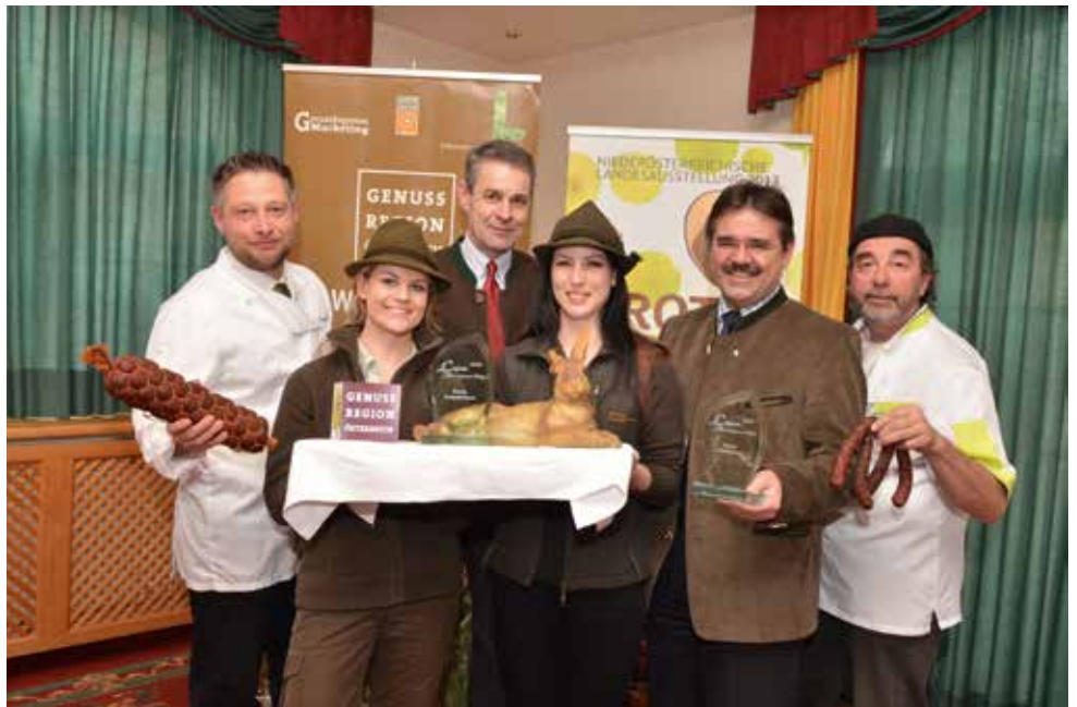
Genuss im Weinviertel mit Brot, Wein und anderen Köstlichkeiten

Eine weitere Botschaft der diesjährigen Ausstellung ist sicher auch die Einladung an die Gäste, nicht nur einen Ausflug in das Viertel, sondern gleich ein paar Tage Urlaub im Weinviertel zu machen - zu sehen und zu genießen gibt es ja genug.