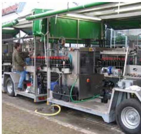
Füllung und Etikettierung in einem Arbeitsgang