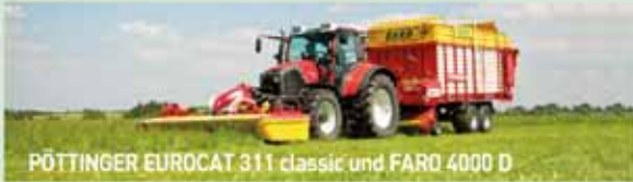
PÖTTINGER EUROCAT 311 classic und FARD 4000 D