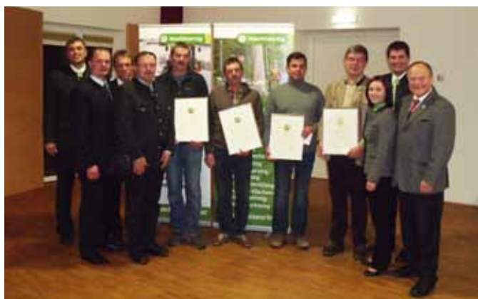
Ehrungen im Zug der Außerordentlichen Vollversammlung