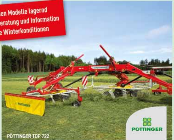
PÖTTINGER TOP 722