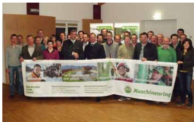
der neue Vorstand des MR Hollabrunn - Horn