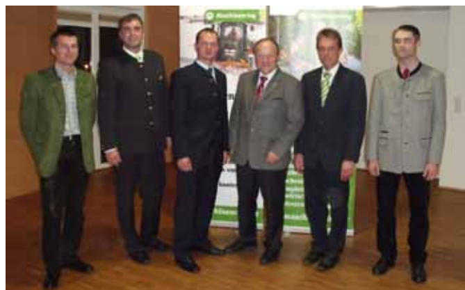
das neue Obmännerteam