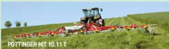
PÖTTINGER HIT 10.11 T