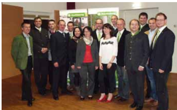
Team des MR Hollabrunn-Horn