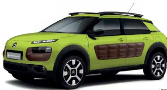
Citroën C4 Cactus

Weitere Informationen bezüglich Autotypen und Rabatte bekommst du bei deinem örtlichen Maschinenring.