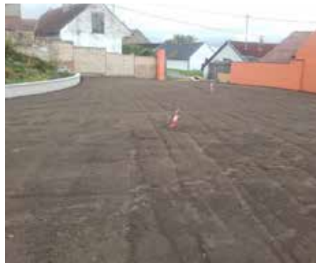
Nach der Verlegung und Einbringung von Erde