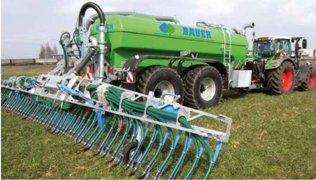
Polyestertankwagen mit Schlepschlauchverteiler, von 10.500 bis 24.000 Liter