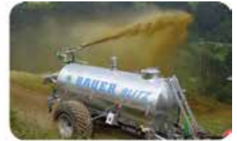
Gütlefässer von 2.200 bis 16.000 Liter. Lange Lebensdauer, hohe Wertbeständigkeit