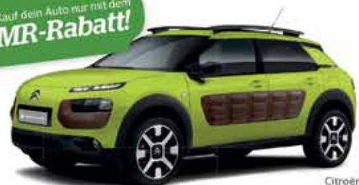
Citroën C4 Cactus

Weitere Informationen bezüglich Autotypen und Rabatte bekommst du bei deinem örtlichen Maschinenring.