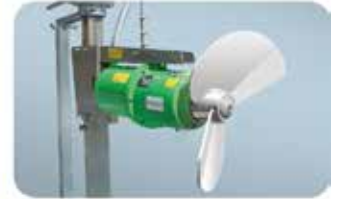
Tauchmotor-Rührwerke mit enormer Rührkraft und hohem Wirkungsgrad