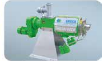
Separatoren zur Separierung von festen und flüssigen Nährstoffen, hoher Durchsatz