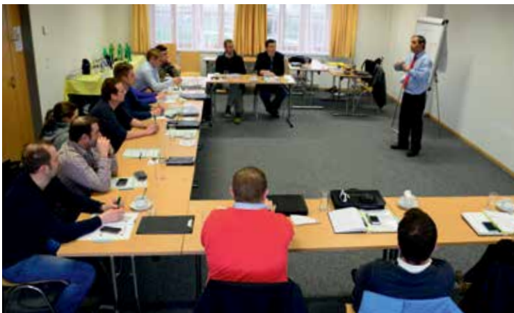
MR Sitzung - Ausarbeitung nachhaltiger Lösungen

der Aufbau eines Qualitätsmanagementsystems im Agrarbereich, Projekte zur Optimierung der internen und externen Kommunikation zwischen den Maschinenringkollegen bzw. zwischen Maschinenringmitarbeitern und Mitgliedern, Kunden und Lieferanten.