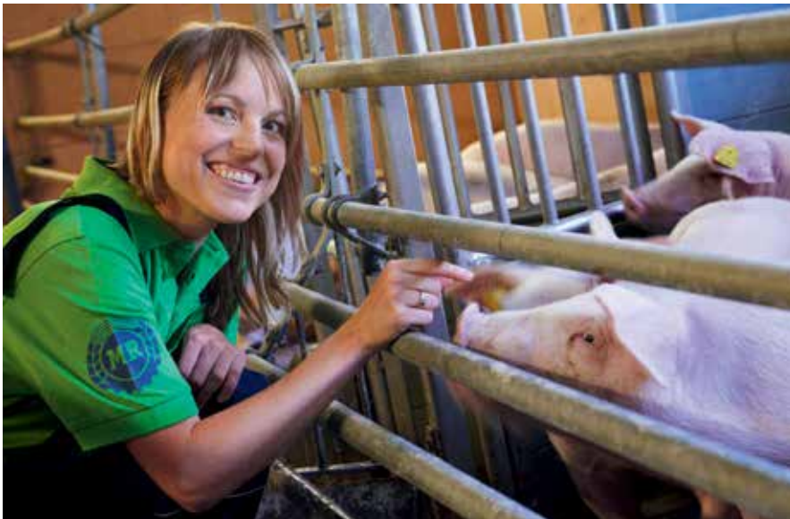
Betriebsshelferin bei der Arbeit

derung die notwendigen Tätigkeiten übernehmen kann, und somit die ausfallende Person ersetzt.