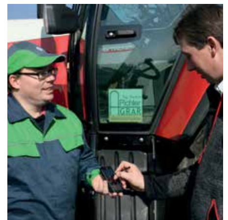
Erstellung E-Lieferschein im Onlinemanager

Weiterentwicklung des MR Onlinemanagers, Feldstück und Schlagbezogene Aufzeichnungsmöglichkeiten inkl. Betriebsmitteleinsatz, sowie Flächenmanagementlösungen und Vermeidung von Doppelgleisigkeiten bei bereits vorhandenen Daten.