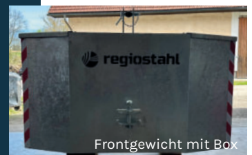
Frontgewicht mit Box