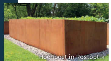
Hochbeet in Rostoptik