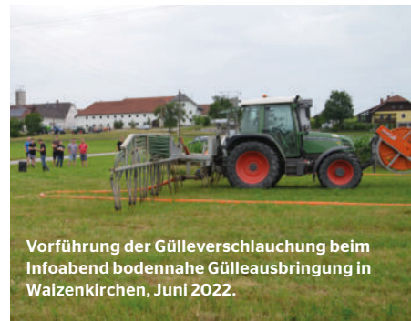
Vorführung der Güllever-schlauchung beim Infoabend bodennahe Gülleausbringung in Waizenkirchen, Juni 2022.

Wenn auch du Interesse hast, in Zukunft deine Gülle im Raum Waizenkirchen, Peuerbach und Umgebung bodennah und bodenschonend auf den hofnahen Flächen auszubringen, melde dich bitte in den nächsten Tagen im MR Büro bei Leitner Gust unter 05 9060 411 11.