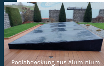
Poolabdeckung aus Aluminium